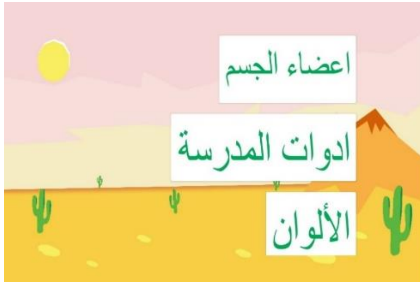
Gambar 3. Salah Satu Implementasi Bagian Aplikasi