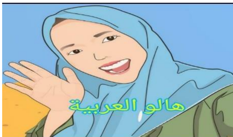
Gambar 1. Implementasi Sistem Tampilan Menu Utama

Berikut Implementasi beberapa gambar Aplikasi :