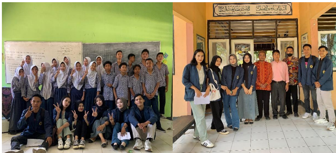
(Wawancara bersama Guru dan Siswa SMPN 2 Sakra Timur)