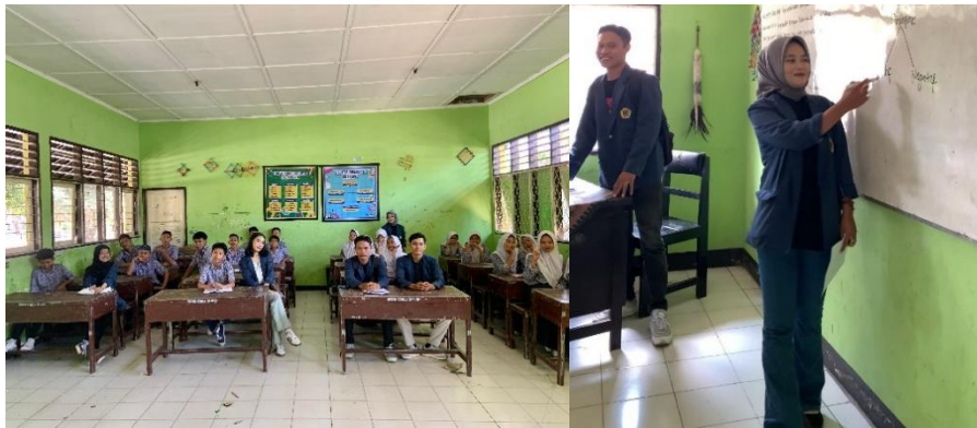
(Sosialisasi bersama Siswa Kelas IX A SMPN 2 Sakra Timur)