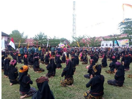
Gambar 2 Pojok Ekspresi

Cara mengatasi kebosanan yang di alami seorang guru yaitu dengan mengadakan pergantian guru di setiap melaksanakan kegiatan P5 dengan tujuan untuk memberikan kesempatan terhadap semua guru untuk mengekspresikan diri karena setiap guru mempunyai cara tersendiri dalam menyampaikan materi sehingga materi pembelajaran tersebut menjadi lebih menarik dan mudah untuk di ingat (Anon n.d.-c). Sedangkan cara mengatasi kebosanan yang di alami oleh peserta didik yaitu dengan memberikan jeda pembelajaran (ice breaking) dengan tujuan untuk merefreshing pikiran sehingga pembelajaran tersebut bisa di terima oleh otak. Jika semua sudah berjalan dengan normal maka pembelajaran tersebut akan mudah di sampaikan dan akan mudah di terima sehingga tujuan dari pembelajaran itu akan dapat tercapai sesuai dengan target dan kebutuhan yang telah di tentukan. Selain itu, untuk mengatasi kebosanan dan kejenuhan dalam pengimplementasian Penguatan Profil Pelajar Pancasila di SMAN 1 Gunungsari, Bapak Lalu Mungguh menjelaskan “siswa diberikan kesempatan untuk mengekspresikan hasil dari pembelajaran yang telah dilakukan selama sebulan sekali yang di laksanakan pada Pojok Ekspresi, yakni acara bulanan untuk merefeksi dan melakukan evaluasi pada pembelajaran yang telah dilakukan setiap bulan”. Siswa juga dapat mengembangkan kreativitas mereka dengan berpartisipasi dalam acara tersebut dengan menampilkan aktualisasi diri seperti pentas seni, tarian, puisi, tarian adat, zikir zaman, dan sebagainya.