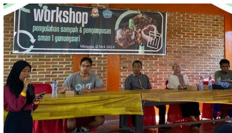
Gambar 4 workshop di SMAN 1 Gunungsari

kemampuan guru dalam memanfaatkan teknologi selama proses pembelajaran menjadi sangat penting untuk menghadapi tantangan zaman. Untuk meningkatkan kompetensi guru di era digital, mengikuti pelatihan guru profesional, mengikuti workshop pelatihan kompetensi guru, serta mereka harus mempelajari cara membuat media pembelajaran berbasis teknologi yang menarik, mengoperasikan aplikasi, dan menggunakan sumber belajar digital lainnya, sehingga menciptakan pengalaman belajar yang lebih aktif dan kreatif, Amelia (2022:5).