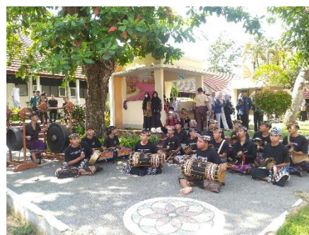
Gambar 3 Pojok Ekspresi

Disamping itu, keterampilan mengajar guru juga menjadi salah satu hambatan dalam implementasi Proyek Penguatan Profil Pancasila (P5) di SMAN 1 Gunungsari. Menjadi seorang guru memerlukan pengetahuan dan kemampuan tertentu untuk memastikan efektivitas pembelajaran. Tanpa penguasaan keterampilan mengajar, sulit bagi guru untuk menjalankan tugasnya dengan baik. Kurikulum Merdeka yang memiliki metode ajar yang luas tentu saja menyulitkan guru untuk bisa beradaptasi dan tidak mudah untuk menerapkan modul ajar tersebut, Oleh karena itu, penting bagi guru untuk terus mengembangkan keterampilan mengajar mereka guna meningkatkan kompetensi pedagogik dan mendukung keberhasilan proses belajar mengajar. (Hadi et al. 2022)