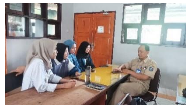
(Gambar 1.1 Peneliti melakukan wawancara.)