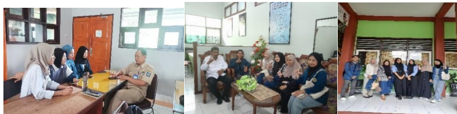
( Gambar 1.2 peneliti mewawancarai guru PPKn, WK Kesiswaan dan Siswa)

5 Mataram, karena kemudahan mengakses informasi membuat mereka lebih mencari tau atau mengakses mengenai informasi yang kurang bermanfaat dibandingkan dengan informasi yang mencakup tentang penguatan identitas nasional bangsa Indonesia. Disisi lain juga semakin berkembang zaman dan teknologi maka sangat dibutuhkan untuk tetap bisa bertahan dan mengikuti apa yang sudah berkembang, juga harapannya bisa membuat identitas nasional tetap terjaga dan lestari.