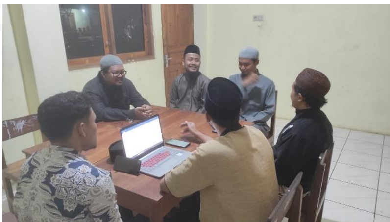
Gambar 1. Pembelajaran Tafsir dan Wawancara dengan Guru dan Mudir Mahad