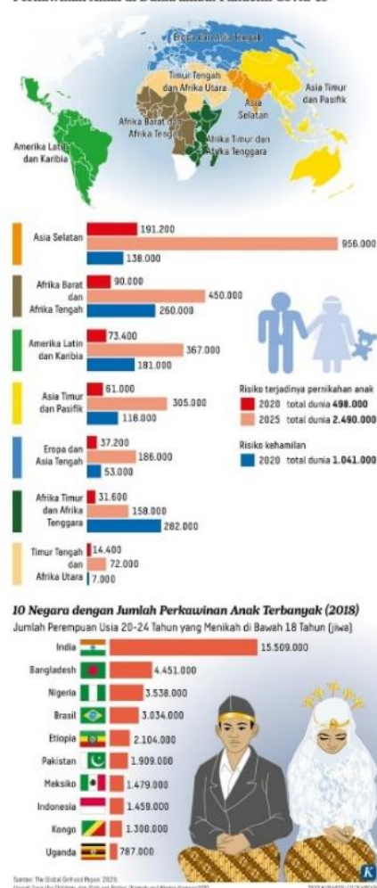
Perkawinan Anak di Dunia akibat Pandemi Covid-19

Kemerosotan akhlak semakin menurun dari tahun ketahun diketahui berdasarkan dari perilaku buruk para pemuda masa kini, Menurut liputan dari situs berita liputan6.com, sekitar 2,7 juta individu di Indonesia terlibat dalam perjudian online, dengan mayoritas di antaranya adalah pelajar dan ibu rumah tangga. Bahkan akun resmi DDR RI dibajak dan menampilkan siaran langsung judi online, tidak hanya itu saja banyak kasus bunuh diri dikalangan pemuda yang disebabkan kurangnya keimanan dalam diri pemuda yang dilansir dari website yang membawakan berita terpercaya seperti detikcom, kompas.com, liputan6, sindonews dan lainnya.