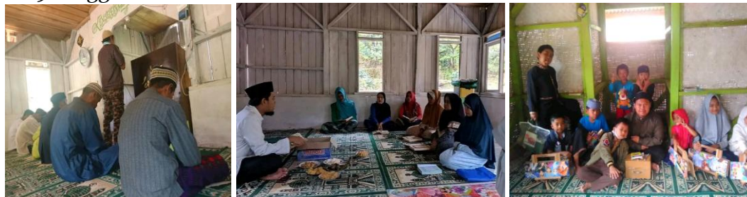
Gambar 2.3.4. Pemuda Persis sedang berdakwah di Kampung Cisoka Sumedang

Kampung ini terletak di Desa Citengah Kecamatan Sumedang Selatan. Terletak 18 KM dari Markaz PD. Pemuda Persis Kab. Sumedang. Pada awal-awal berdakwah sekitar tahun 2019 di kampung ini tidak ada listrik. Musola yang ada masih berbentuk bangunan setengah permanen berdinding kayu. Menuju lokasi harus melwati jalan berbukit penuh batu dan berkerikil. Namun, seiring waktu pemerintah Kabupaten Sumedang memberikan bantuan perbaikan jalan dan pemasangan listrik pada tahun 2023. PD. Pemuda Persis Sumedang melakukan dakwah ke tempat ini setiap hari jumat yaitu dengan mengisi khutbah jum'at, pengajian untuk ibu-ibu dan anak-anak. Kegiatan tersebut dilakukan oleh Pemuda Persis secara konsisten sejak 2019 hingga saat ini.