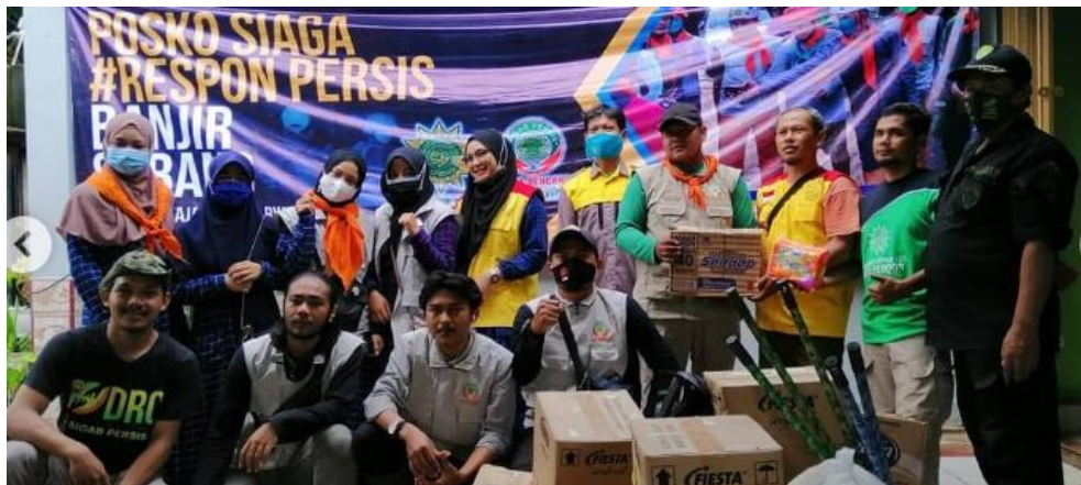
Gambar 6. Pemuda Persis bersama dalam tim SIGAB Persis sedang menyampaikan bantuan dan evakuasi di wilayah Bencana Banjir Subang

Pendekatan ini selaras dengan kerangka strategis M. Amien Rais yang menekankan perlunya perluasan dakwah ke berbagai sektor kehidupan, termasuk ekonomi, kebijakan publik, dan ruang sosial kemasyarakatan. Kegiatan dakwah di lingkungan industri mencerminkan gagasan bahwa dakwah harus hadir di pusat-pusat produksi dan pengambilan keputusan, bukan hanya di ruang ibadah. Sementara keterlibatan dalam kebencanaan menunjukkan implementasi dakwah melalui tindakan nyata yang menyentuh aspek kemanusiaan dan pemberdayaan sosial. Respons terhadap isu kontemporer ini juga memperlihatkan keberadaan generasi muda sebagai aktor strategis dalam menjaga relevansi dakwah di era informasi. Dengan demikian, praktik yang dijalankan Pemuda Persis Sumedang memperlihatkan dakwah yang adaptif, solutif, dan berorientasi pada keberlanjutan gerakan di tengah perubahan sosial yang cepat.