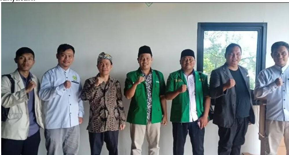
Gambar 5. Pemuda Persis bersama utusan GP. Ansor dan Pemuda Muhammadiyah dalam diskusi damai menjelang Pemilu

Praktik dakwah berdampak melalui aksi sosial dan kolaborasi tersebut merefleksikan implementasi nyata dari kerangka strategis M. Amien Rais mengenai perluasan pendekatan dakwah yang tidak hanya dilakukan melalui lisan, tetapi juga melalui tindakan konkret yang menyentuh kehidupan umat. Pengiriman da'i ke wilayah marginal menunjukkan adanya pembacaan terhadap realitas sosial sebelum perumusan program, yang selaras dengan gagasan pentingnya laboratorium dakwah sebagai ruang identifikasi problem umat. Kegiatan sosial seperti pembinaan Al-Qur'an, distribusi bantuan, dan pendampingan masyarakat memperlihatkan bahwa dakwah telah bergerak ke ranah pemberdayaan dan transformasi sosial, bukan sekadar penyampaian pesan normatif. Kolaborasi lintas organisasi kepemudaan juga menunjukkan penguatan jejaring dakwah dalam ruang publik, sebagaimana ditekankan Amien Rais tentang pentingnya kehadiran Islam dalam dinamika sosial dan kebangsaan. Dengan demikian, dakwah yang dijalankan Pemuda Persis Sumedang tidak hanya komunikatif, tetapi juga transformatif dan strategis dalam membentuk generasi muda sebagai pelaku perubahan sosial-keagamaan yang berkelanjutan.