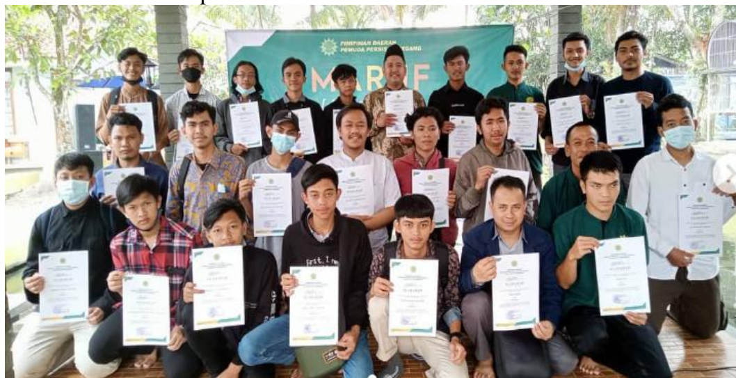
Gambar 1. Para Pemuda Persis diberi Syahadah (Sertifikat) setelah menyelesaikan satu jenjang kaderisasi sebagai bagian dari Pendidikan Kader Dakwah Pemuda Persis

Ma'ruf merupakan pondasi utama dalam membentuk karakter dan arah gerakan Pemuda Persis. Dalam Ma'ruf, tauhid tidak hanya dipahami sebagai konsep teologis semata, tetapi menjadi asas dalam berpikir, bersikap, dan bergerak. Wajah dan wajah Pemuda Persis dibentuk melalui komitmen terhadap kemurnian tauhid, yang menjadi penentu orientasi perjuangan dakwah mereka. Kesadaran akan nilai-nilai tauhid menjadi pengarah dalam setiap aktivitas, sehingga melahirkan kader-kader yang tegas dalam prinsip dan moderat dalam pendekatan.